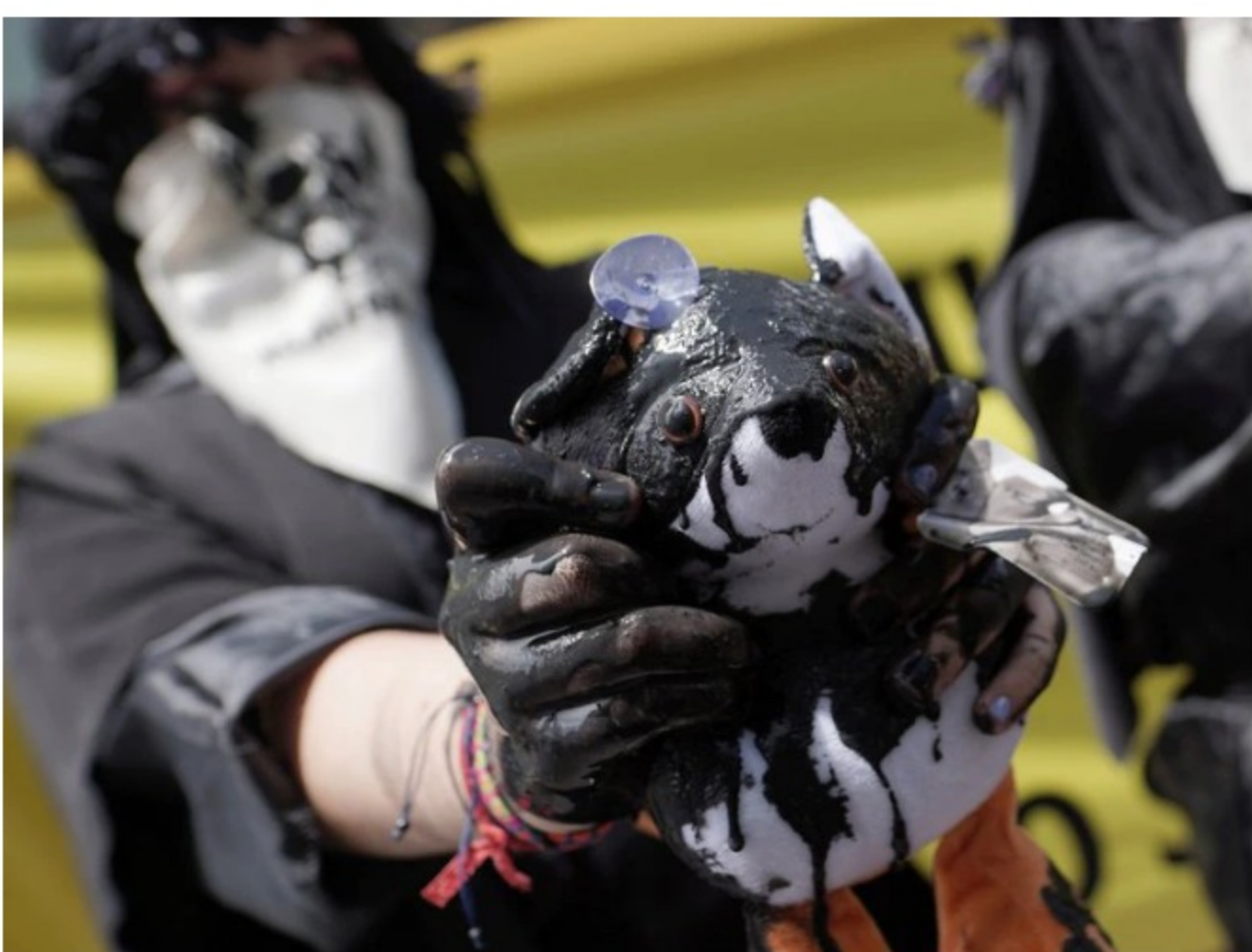
A demonstrator holds a stuffed animal covered in oil during a protest against the use of fracking in Bogota, Colombia, July 30, 2021.

Asimismo, esta política pública deberá establecer unas metas progresivas, medibles, con la intención de disminuir la explotación en un 50 % durante los próximos diez años y de exploración en un 80 % durante este periodo, en el que se deberá fomentar la transición energética y las economías locales.