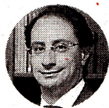
José Manuel Restrepo Ministro de Hacienda

HACIENDA. PARA LA PONENCIA SE INCLUYERON ALGUNAS PROPUESTAS DE LOS CONGRESISTAS, COMO AMPLIAR EL PAEF HASTA 2022 Y MEDIDAS QUE PERMITAN VENDER ACTIVOS DE LA SAE