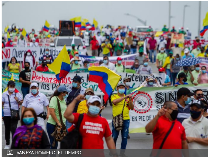
VANEXA ROMERO. EL TIEMPO