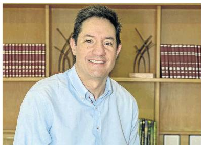
Banco de Occidente