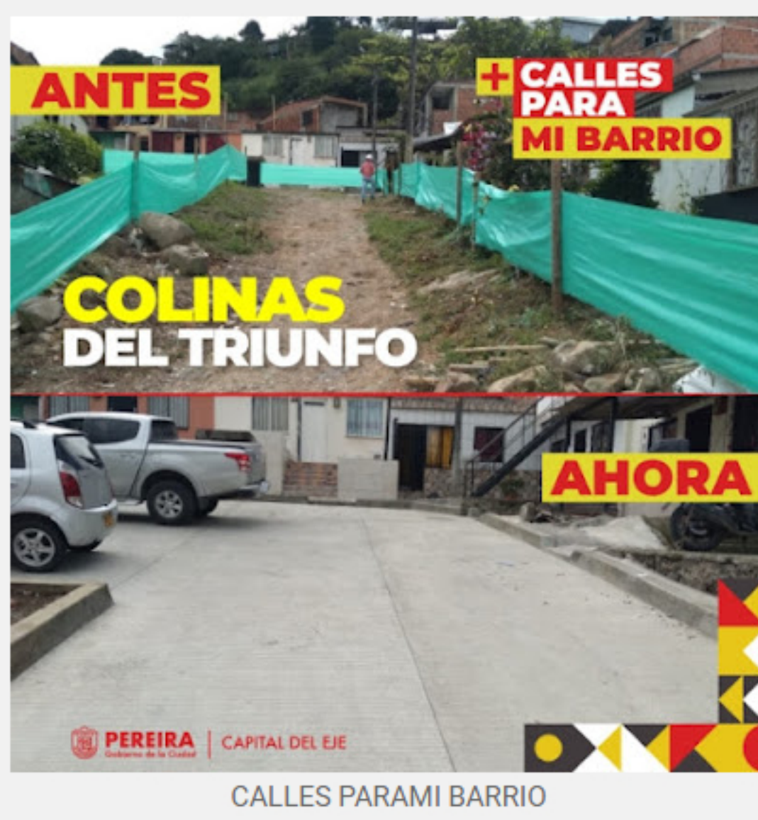
CALLES PARAMI BARRIO