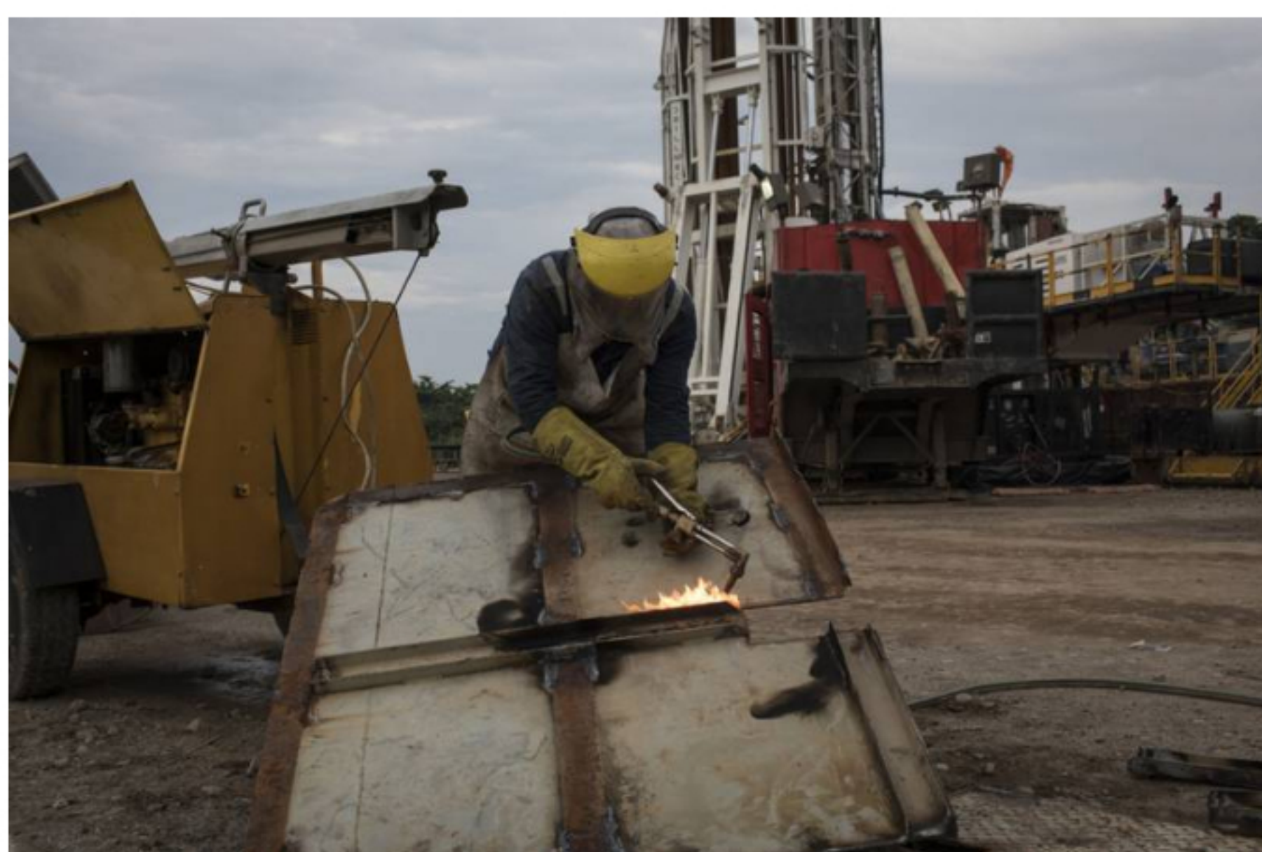
Un empleado opera una antorcha durante las operaciones de mantenimiento en un sitio de extracción cerca de la refinería de Ecopetrol SA en Barrancabermeja, Santander, Colombia, el viernes 20 de abril de 2018.

Los departamentos con mayor contratación fueron Santander, Norte de Santander y Meta.