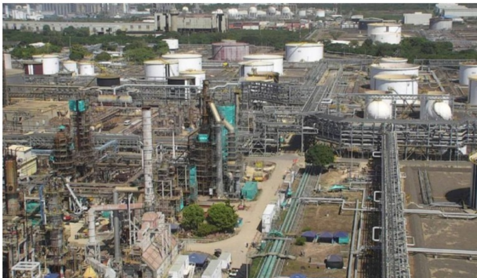
La Refinería informó que inició el plan de restablecimiento de las unidades de proceso tras su salida de operación por una falla eléctrica

La Refinería informó que inició el plan de restablecimiento de las unidades de proceso tras su salida de operación por una falla eléctrica