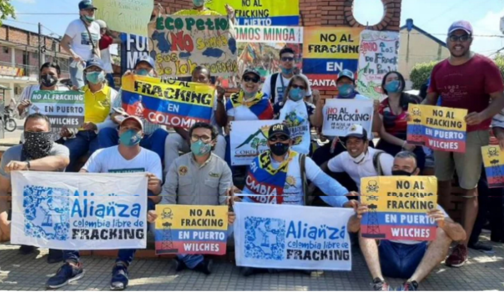
La decisión del Consejo de Estado marcará la senda de la respuesta a la crisis climática de Colombia.

Este es un espacio de expresión libre e independiente que refleja exclusivamente los puntos de vista de los autores y no compromete el pensamiento ni la opinión de Las2Orillas.