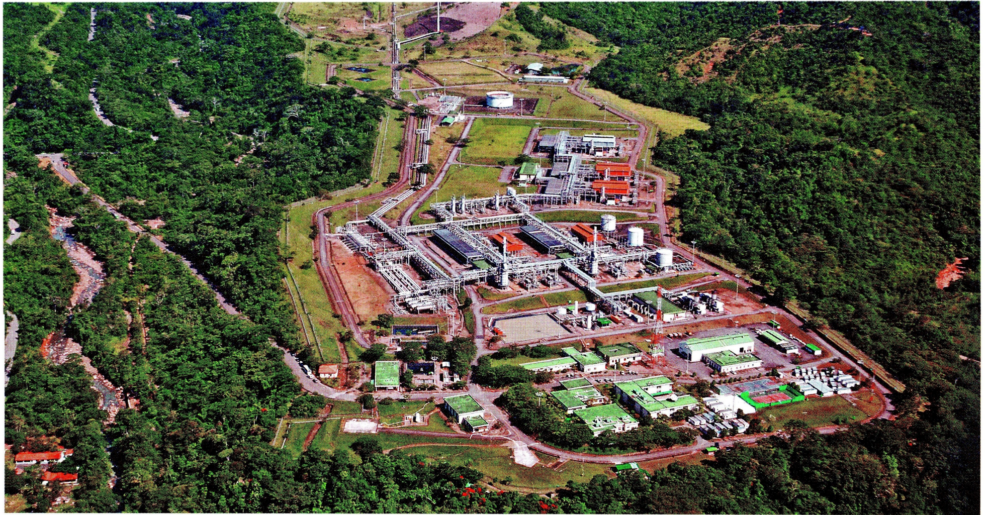
Las plantas de Cusiana (foto) y la de Cupiagua, ambas en Casanare, producen el 60% del gas consumido en el país.