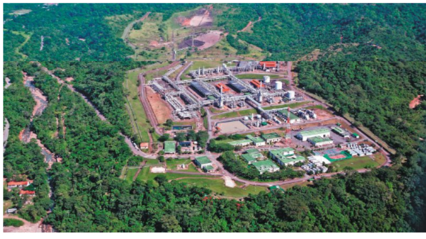
Las plantas de Cusiana (foto) y la de Cuplagua, ambas en Casanare, producen el 60% del gas consumido en el país.