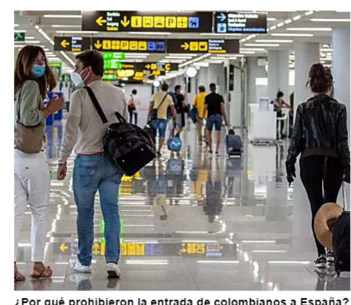
¿Por qué prohibieron la entrada de colombianos a España?