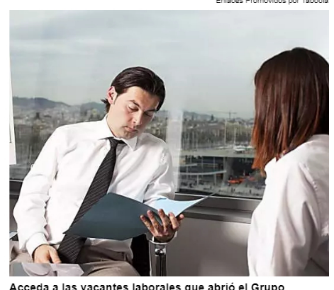
Acceda a las vacantes laborales que abrió el Grupo Emergia en Medellín