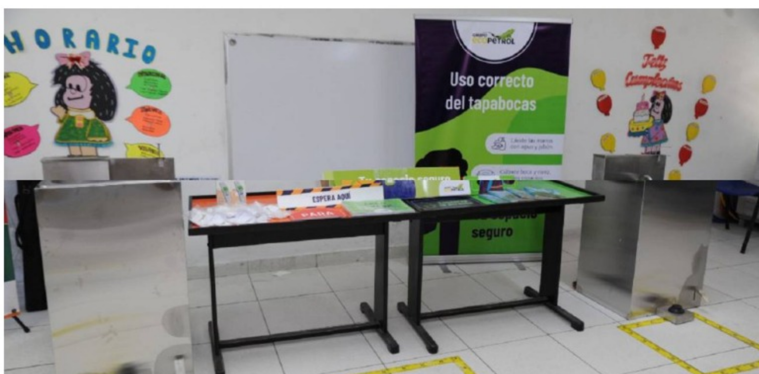
En total se benefician 17 mil estudiantes de las instituciones educativas de Ararca, Tierrabomba, Barú, Santa Ana, Pasacaballos, entre otras / Ecopetrol

En total se benefician 17 mil estudiantes de las instituciones educativas de Ararca, Tierra Bomba, Barú, Santa Ana, Pasacaballos, entre otras