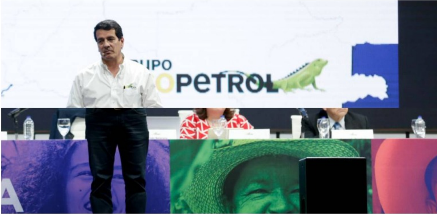
Ecopetrol asume el control de ISA

La compañía efectuó el pago de 14.2 billones de pesos por el 51.4% de las acciones de ISA.