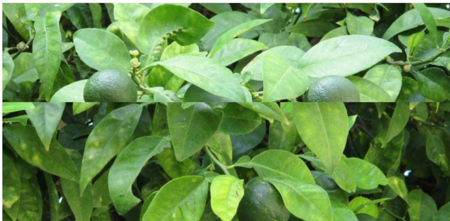
Limón Tahití

El proyecto de negocios agrícolas entorno a la producción de limón Tahití en la zona rural de Yaguará beneficia a 65 familias