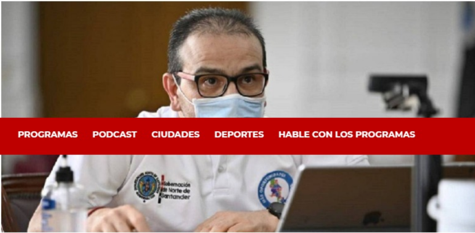
Gobernador de Norte de Santander, Silvano Serrano