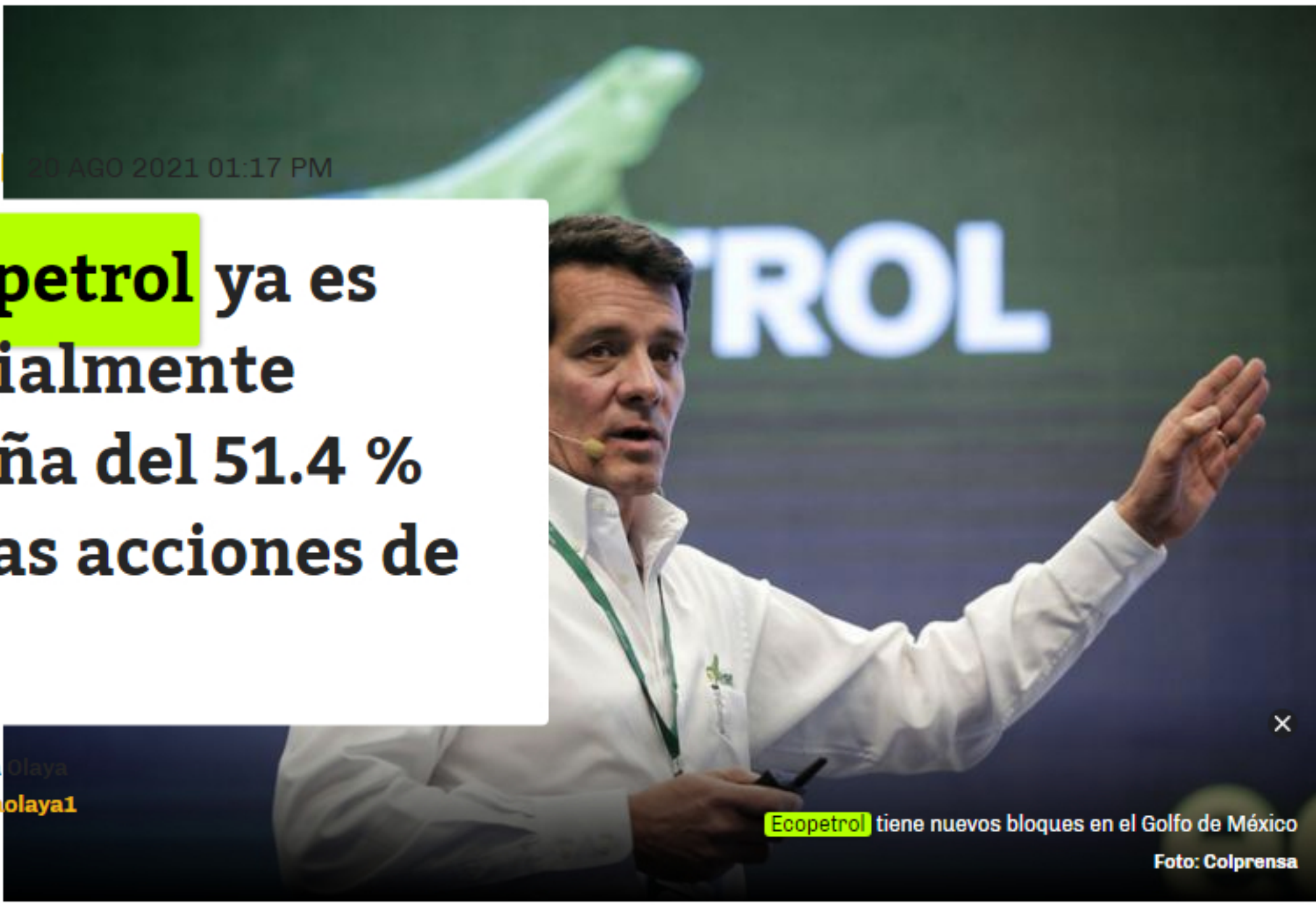
Ecopetrol tiene nuevos bloques en el Golfo de México

Compartir La compañía anunció que este viernes hizo la transacción acordada de $14.2 billones.