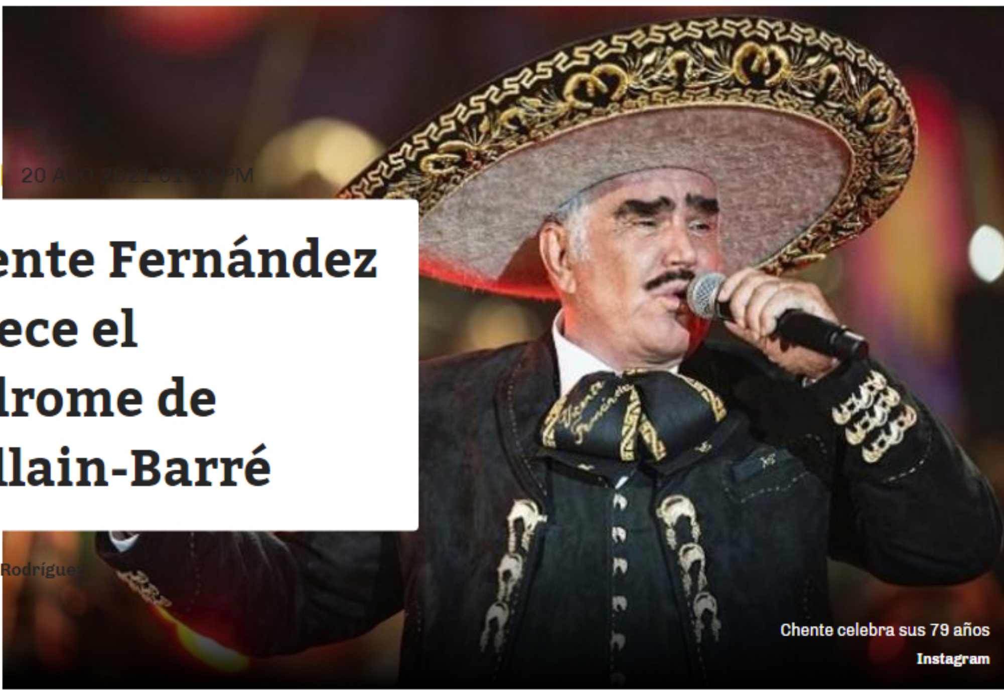
Chente celebra sus 79 años Instagram

Compartir Familiares del cantante aseguraron que su estado de salud sigue mejorando a paso lento.