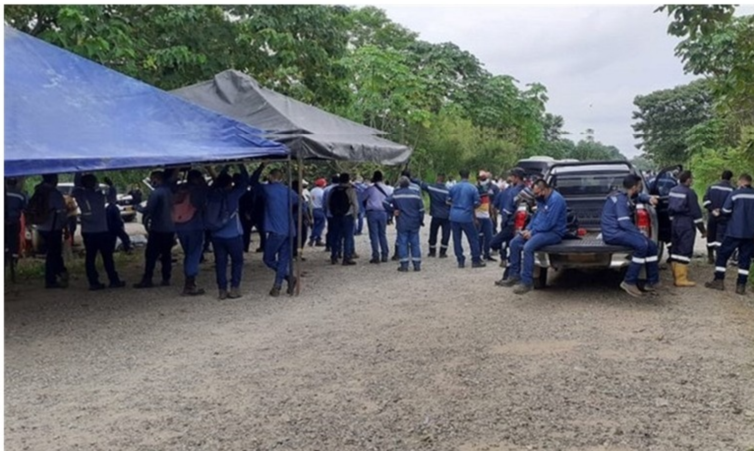
Piden a Ecopetrol asumir trabajadores de Mansarovar en los campos petroleros en Boyaca Lead: La multinacional Mansarovar entregará la operación a Ecopetrol el próximo cuatro de noviembre en los campo.

La multinacional Mansarovar entregará la operación a Ecopetrol el próximo cuatro de noviembre en los campos ubicados en Puerto Boyacá y la Serranía de las Quinchas.