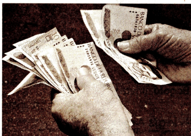
La pandemia ha acelerado la solicitud de pensiones. CEET