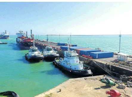
Puerto Bolívar, donde hace presencia la Autoridad Marítima Colombiana.