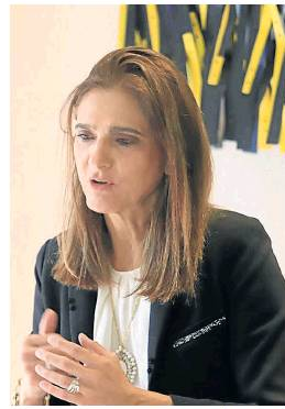
Ministerio de Transporte