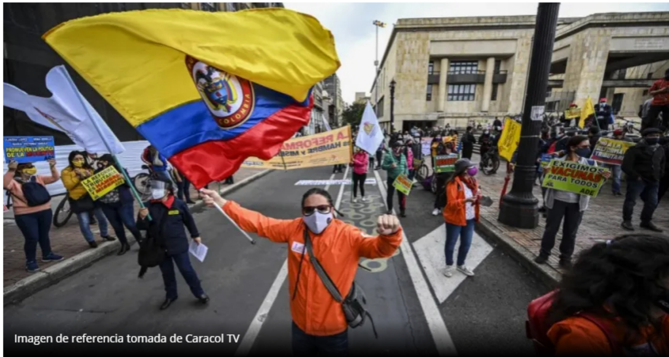
Imagen de referencia tomada de Caracol TV

Fecha: 09/08/2021 Categoría: Noticias Autor: Editor Agencia de Información Laboral