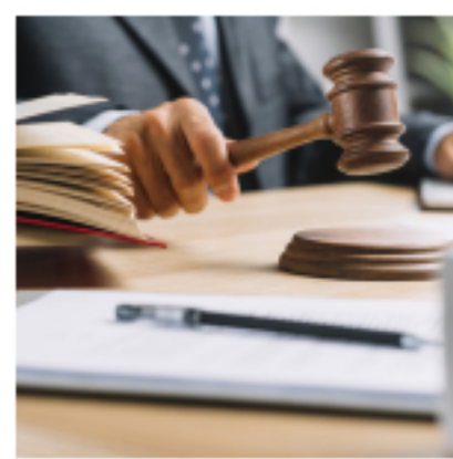
Ley 2101 de 2021; una reivindicación gremial