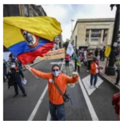
Conozca los proyectos de ley que presentó el Comité Nacional de Paro en el Congreso