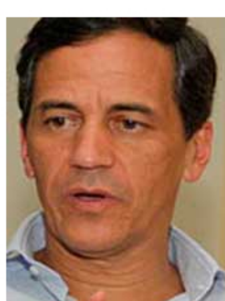
Por Rafael Nieto Loaiza