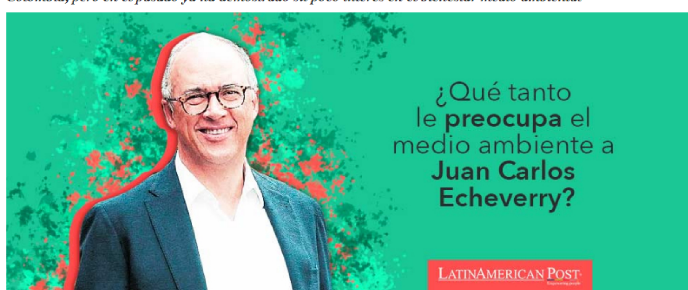
¿Qué tanto le preocupa el medio ambiente a Juan Carlos Echeverry?

El ex ministro de Hacienda y ex presidente de Ecopetrol busca convertirse en el nuevo presidente de Colombia, pero en el pasado ya ha demostrado su poco interés en el bienestar medio ambiental