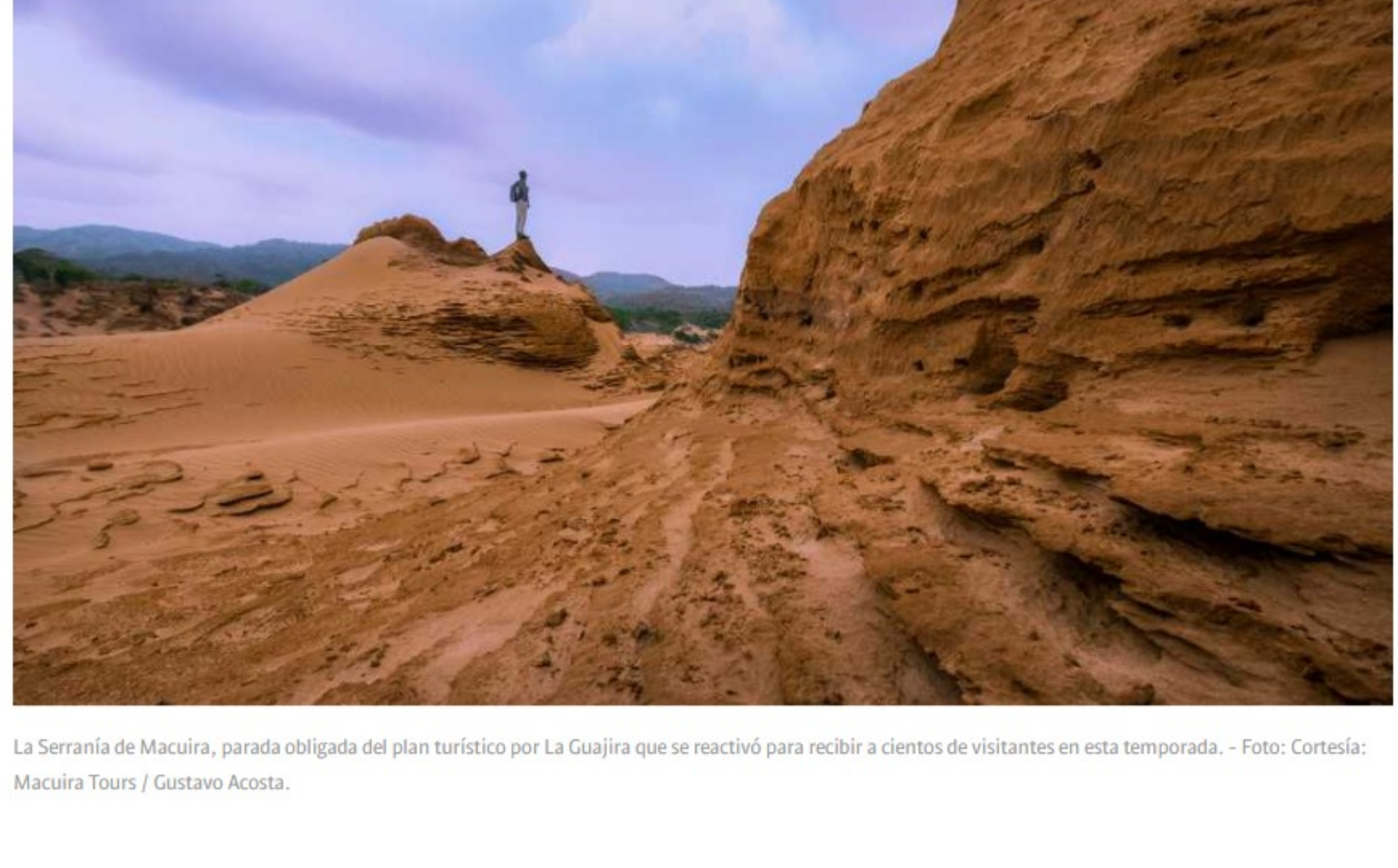
La Serranía de Macuira, parada obligada del plan turístico por La Guajira que se reactivó para recibir a cientos de visitantes en esta temporada.

Este 2021 ha estado marcado por la visita de turistas nacionales, que llegan desde Bogotá, Medellín y Cali, casi en un ciento por ciento, pues en el último año solo han recibido tres extranjeros. Una vez llegan a La Guajira los visitantes tienen garantizado el transporte, el hospedaje y la alimentación. Lo único que no incluyen las ofertas turísticas de la mayoría de los operadores del territorio, como Macuira Tours, son los boletos aéreos. Un plan promedio de cuatro días y tres noches puede costar cerca de 1.500.000 pesos por persona.