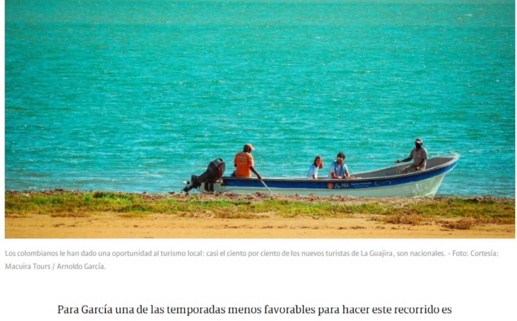
Los colombianos le han dado una oportunidad al turismo local: casi el ciento por ciento de los nuevos turistas de La Guajira, son nacionales.

Precisamente en Punta Gallinas está prevista la inmersión cultural con las comunidades wayúu, en donde sus miembros comparten saberes sobre su vestimenta, bailes y comida típica. Como parte de la experiencia, a los turistas se aseguran probar el famoso friche, que tiene como ingrediente principal la carne de chivo, complemento de un amplio menú marino, rico en mariscos y pescados como el pargo, mero y róbalo. “De aquí se parte en lancha para hacer avistamiento de flamencos rosados en bahía Hondita” .