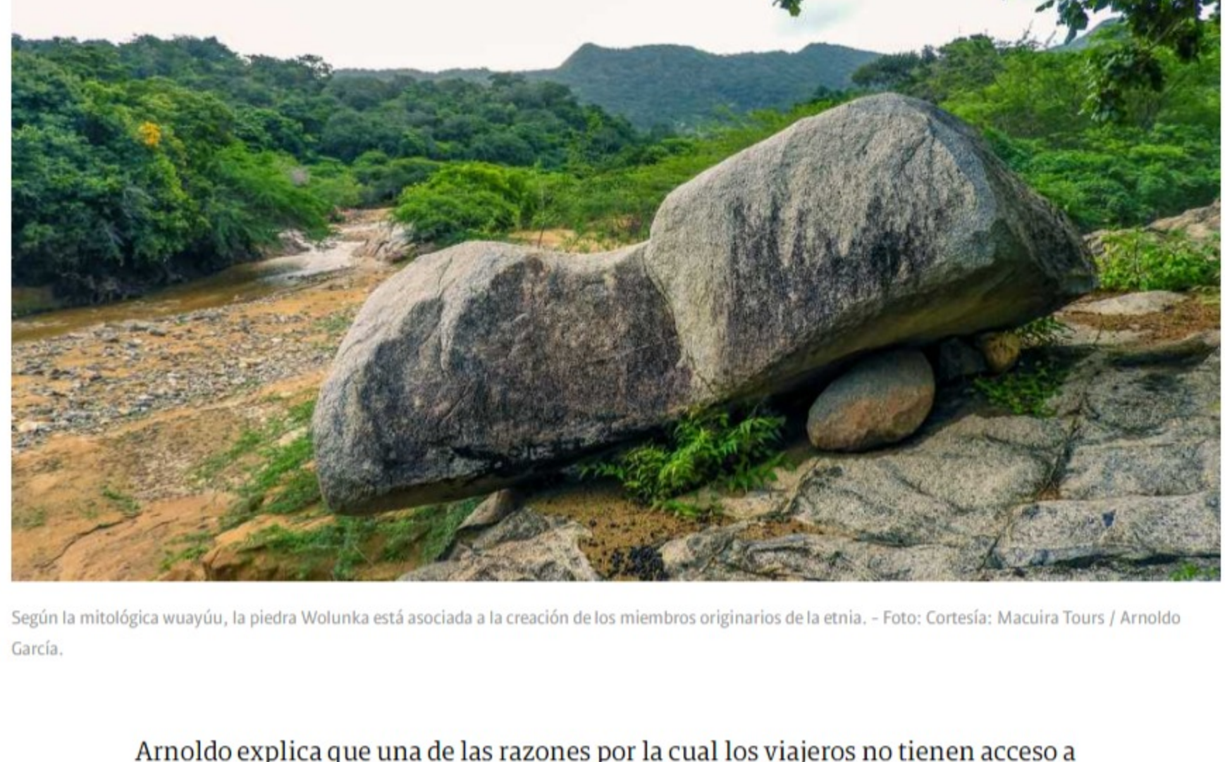
Según la mitológica wayúu, la piedra Wolunka está asociada a la creación de los miembros originarios de la etnia.

El Parque Nacional Macuira es el número 17 del Sistema de Parques Nacionales Naturales de Colombia que reabre al ecoturismo. “Cuenta con aproximadamente 25 mil hectáreas, y aunque se tiene acceso a todas las áreas, una de las más llamativas para visitar son las dunas de Aleewolu, que son formaciones de arena en medio de la serranía”, comenta Arnoldo. Muchos de los sitios por los que transitan los turistas son lugares sagrados de la mitología wayúu, entre ellos las dos piedras que también hacen parte de los atractivos de la única ruta que, por ahora, está disponible para los turistas.