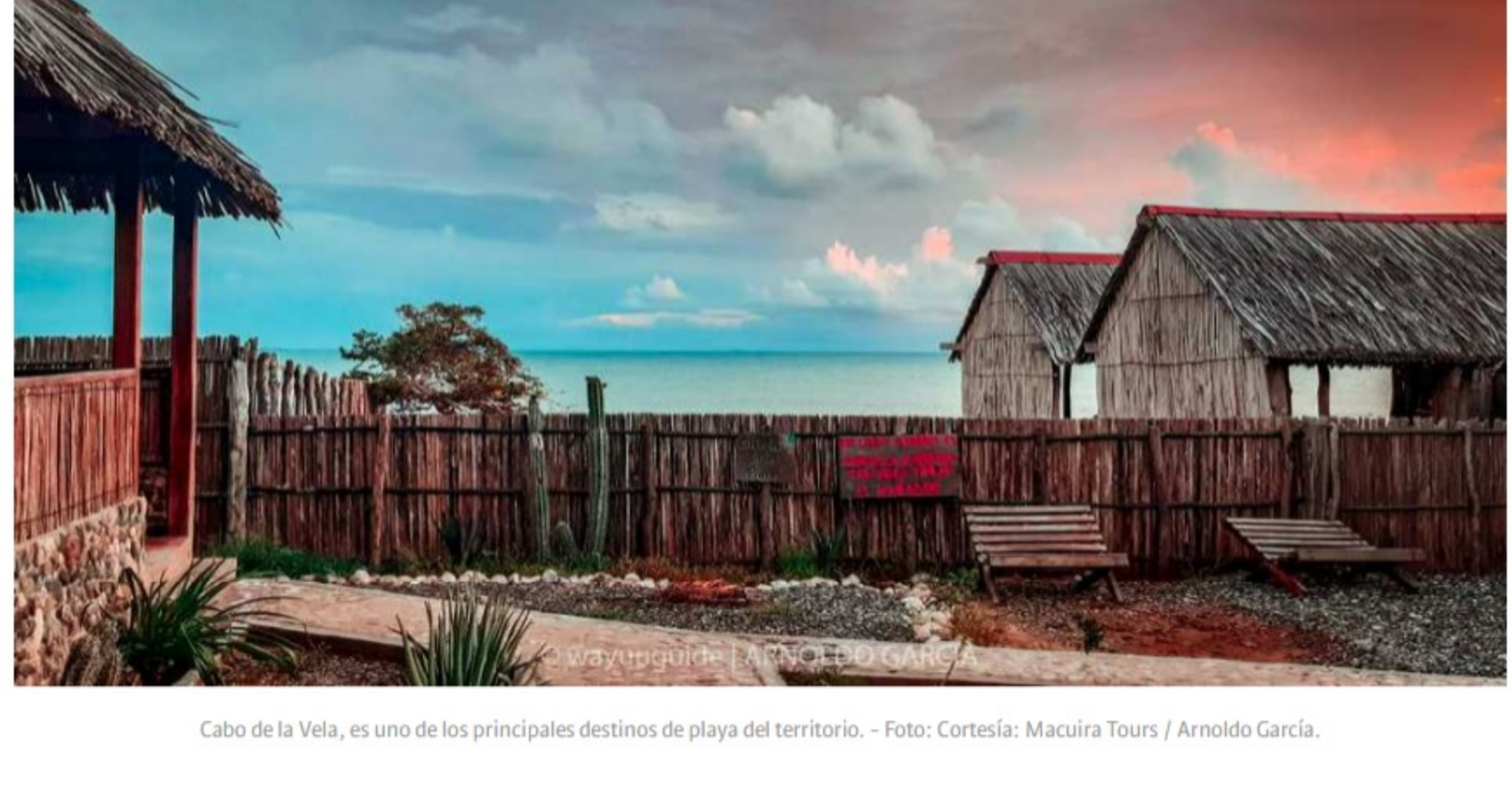
Cabo de la Vela, es uno de los principales destinos de playa del territorio.

El Parque Nacional Natural Macuira es una de las paradas obligadas cuando se viaja a La Guajira, pero no la única. “Los tours empiezan en la ciudad de Riohacha e incluyen recorridos por la Península. El primer día se visitan las Salina de Manaure, en el municipio de Manaure. Luego pasamos por Uribia, que es la capital indígena de Colombia, con rumbo al Cabo de la Vela, donde los turistas pasan toda la tarde en actividades de playa”, precisa Arnoldo.