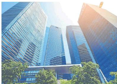
Banco de Bogotá

El Banco de Bogotá presentó una nueva línea de crédito para incentivar la construcción de inmuebles con estándares de sostenibilidad, dirigida tanto a empresas del sector como a las personas que adquieran este tipo de bienes. Dentro de los beneficios para los constructores están el descuento en tasa de interés, el crédito en pesos con tasa fija y el desembolso preoperativo hasta de 10%. (IC)