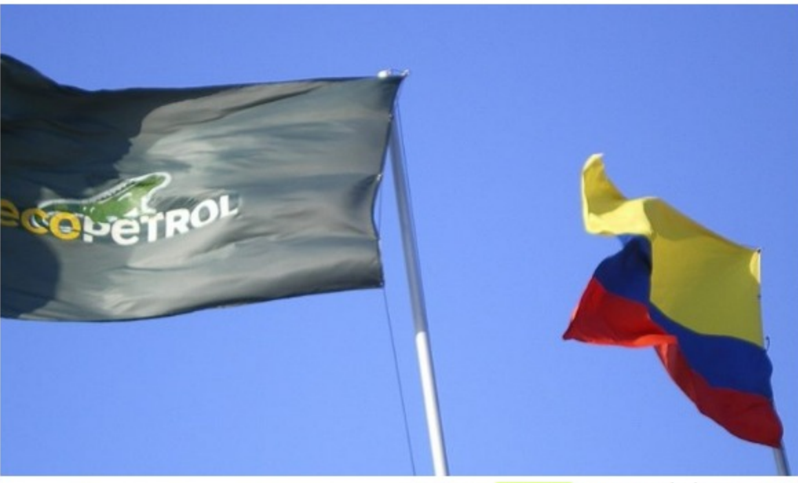
Bandera de Ecopetrol y de Colombia.

dpa... Agencia DPA — Madrid 4 agosto, 2021 0