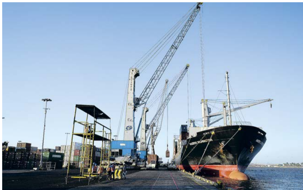
Un barco en uno de los muelles de la sociedad Puerto de Barranquilla.

Las exportaciones no minero energéticas del departamento hacia Estados Unidos crecieron en un 36,8 % en los primeros cinco meses del año.