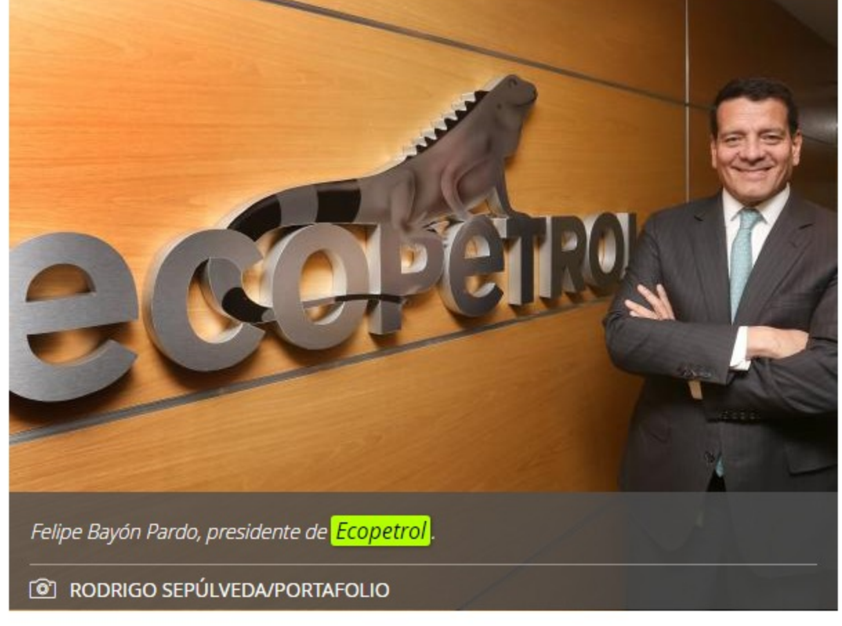
Felipe Bayón Pardo, presidente de Ecopetrol .

“Fue aprobada la cesión de intereses de participación cruzada con ExxonMobil en los Proyectos Piloto de Investigación Integral (PPII) en los proyectos Kalé (62,5%) y Platero (37,5%), ubicados en Puerto Wilches (Santander), quedando Ecopetrol como operador, con un 62,5% de interés de participación en Kalé y un 37.5% en Platero”, indicó Bayón.