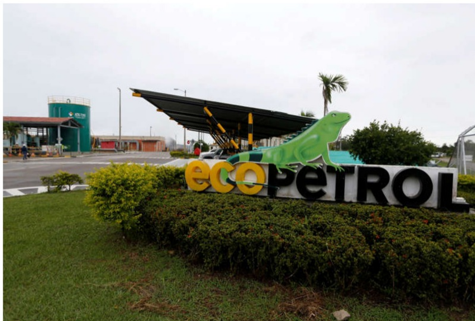
Foto de archivo. Entrada de los campos de producción Castilla de Ecopetrol en el departamento del Meta

BOGOTÁ, 2 ago (Reuters) - La utilidad neta de la petrolera colombiana Ecopetrol subió en el segundo trimestre a un récord de 3,72 billones de pesos (963,4 millones de dólares), por encima de los 25.000 millones de pesos que alcanzó en igual periodo del año pasado, informó el martes la empresa.