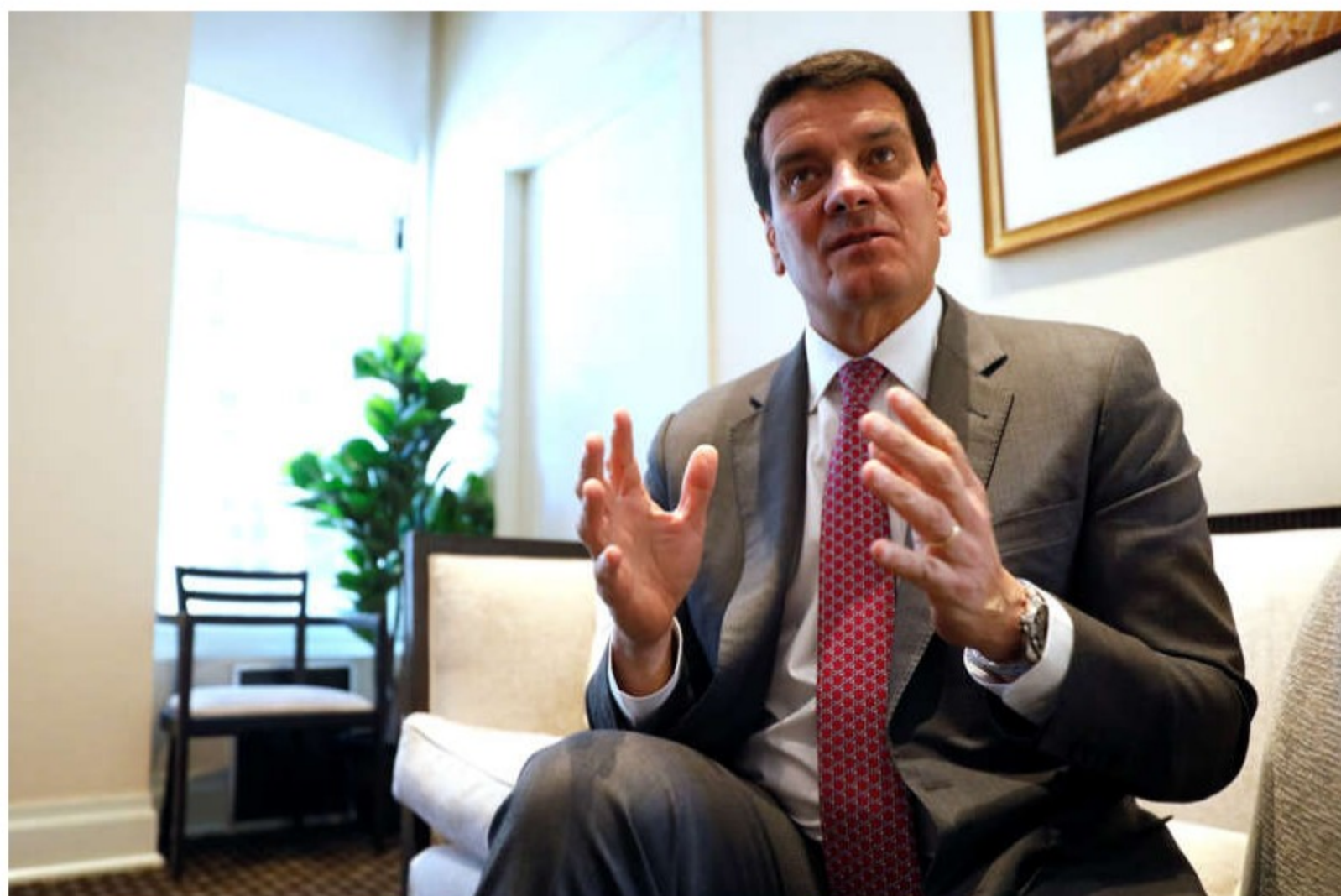
Foto de archivo. El presidente de la petrolera colombiana Ecopetrol , Felipe Bayón, habla durante una entrevista con Reuters en Nueva York, EEUU, 5 de marzo, 2019.

"Además de los fundamentales favorables observados en el trimestre (Brent de 69,1 dólares y tasa de cambio promedio de 3.691 pesos por dólar), nuestro continuo compromiso con la optimización de costos y captura de eficiencias, así como el excelente desempeño de la gestión comercial, soportaron los resultados", dijo el presidente de Ecopetrol Felipe Bayón, citado en un comunicado.