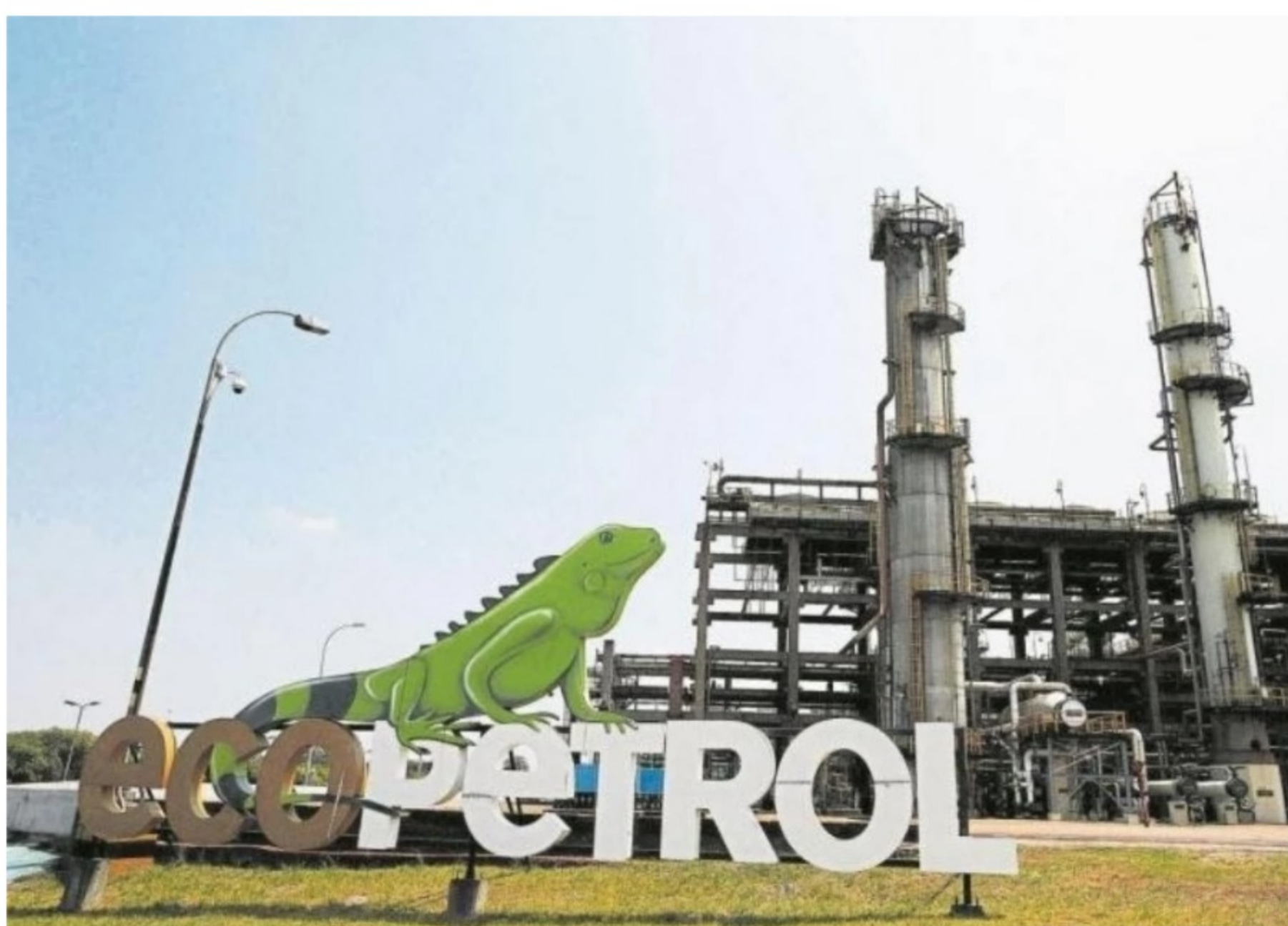
Blu Radio. Ecopetrol .