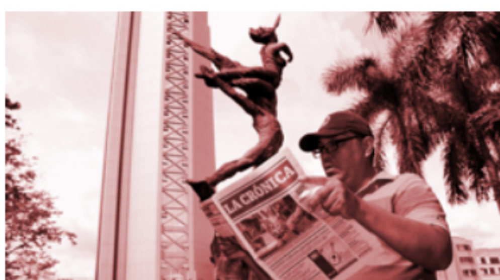
Opinión Sostenibilidad en las empresas