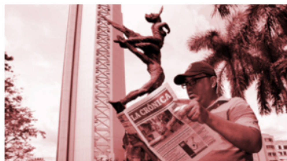
Opinión Incapaces de frenar la corrupción