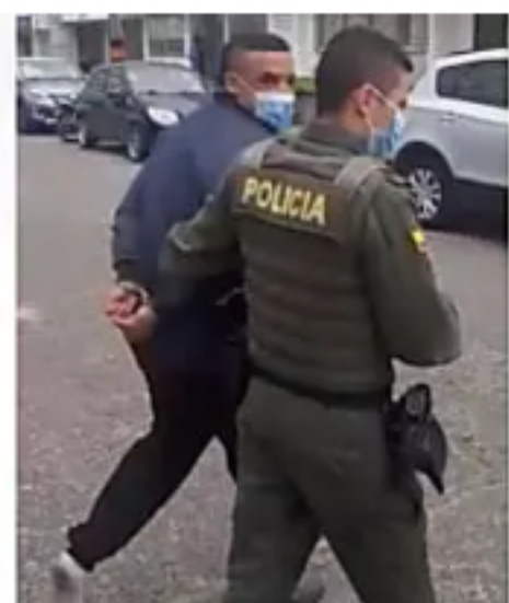
Cuando salga también me los voy a fumar a ustedes, alias 'El Negro'