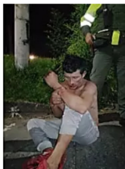
Hombre fue linchado en el barrio Nuevo Armenia