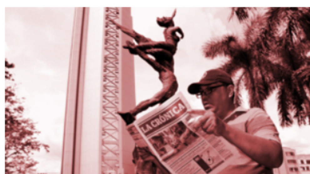
Opinión El talante democrático