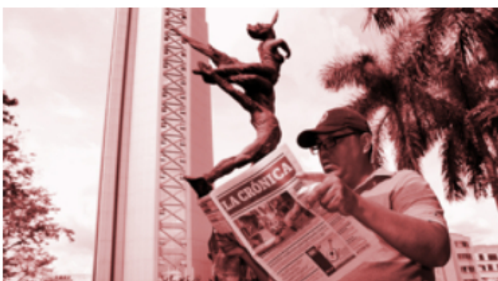
Opinión Un buen café