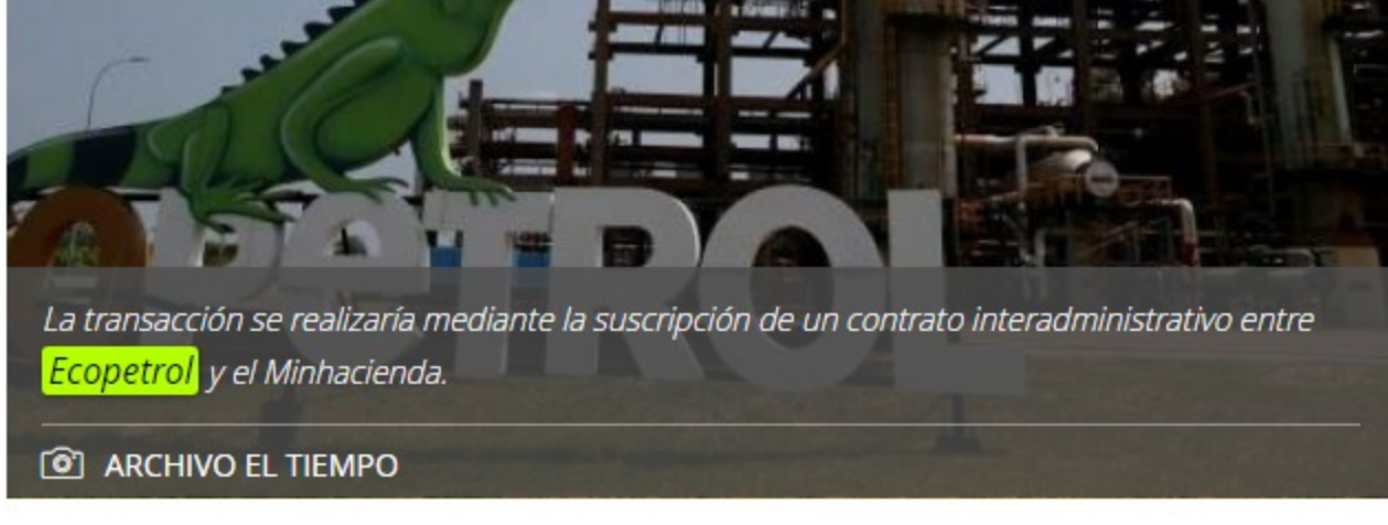
La transacción se realizaría mediante la suscripción de un contrato interadministrativo entre Ecopetrol y el Minhacienda.

A continuación: Las empresas que mandan en el negocio del 'offshore' en Colombia