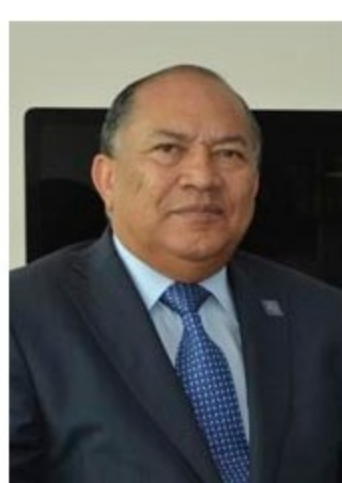
Por Amylkar Acosta