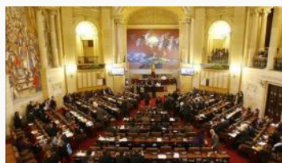
En el Congreso revivieron las 16 curules de paz