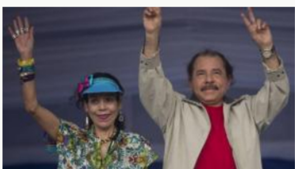
En Nicaragua, Daniel Ortega buscará su cuarta reelección consecutiva