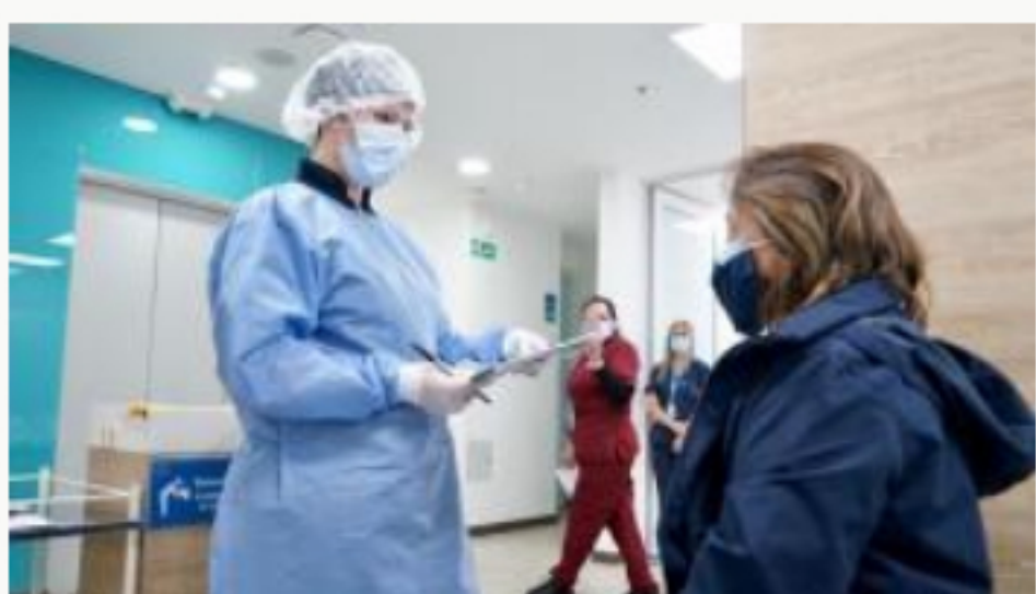
En Colombia alrededor de 61.000 docentes no se han vacunado