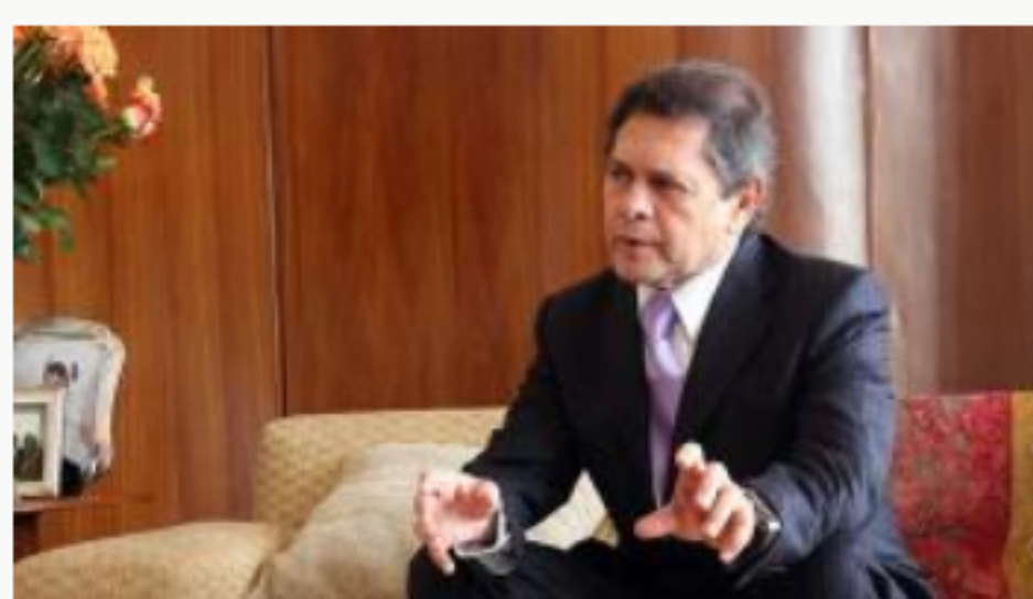
Caso Mattos: “Querían que no siguiera colaborando con la Fiscalía”