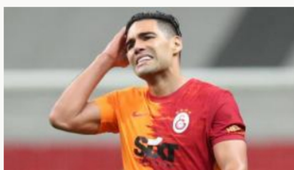
Falcao no seguiría en el Galatasaray