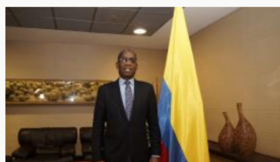
Desde Haití se informa que no hay irregularidad en trato a mercenarios