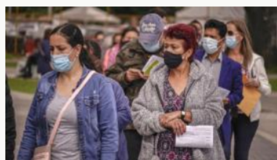
Covid-19 hoy en Colombia: 6.636 casos nuevos y 218 fallecidos