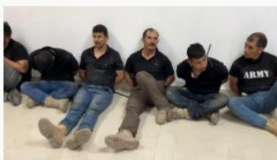
Cancillería ordena a Cónsul en Haití visitar a militares detenidos tres veces por semana