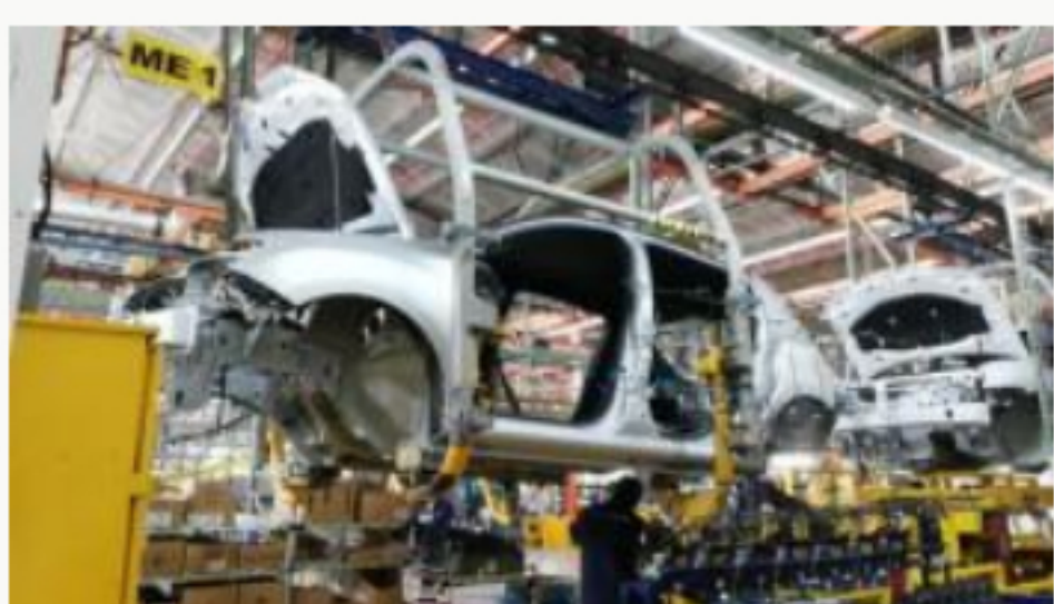
En el 2021 aumentarán las ventas de vehículos en un 54,6%