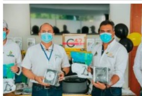
Barrancabermeja recibió 25 ventiladores no invasivos para atender pacientes COVID

"De esta manera seguimos fortaleciendo la oferta de servicios para la atención a pacientes COVID-19 y lograremos salvar más vidas. El funcionamiento de estos equipos de última tecnología permite que el paciente reciba ventilación sin necesidad de ser intubado", explicaron desde la Alcaldía.