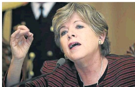
Alicia Bárcena, directora ejecutiva de la Cepal , resaltó la importancia del recurso hídrico que tiene los países de América Latina.

Así mismo, en Argentina se ha hablado de la privatización del sector hidroeléctrico y de agua potable, mientras que en Colombia y Bolivia está la privatización de una serie de servi-