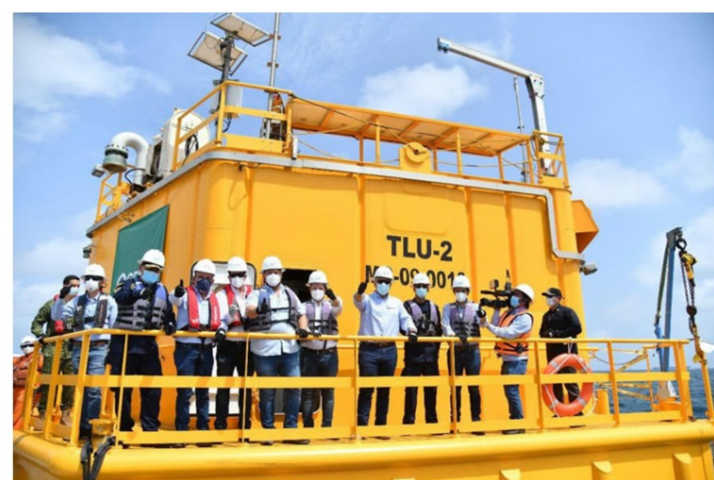
Con presencia del Grupo Ecopetrol y Gobierno Nacional, Ocesa inauguró Unidad de Cargue de Crudo TLU-2 en Coveñas

Estas labores de alta ingeniería se hicieron en el marco del Proyecto Conport , la estructura organizacional con la que la que Ocesa ejecutó las obras, que contaron con el respaldo del Grupo Ecopetrol , de los contratistas, los usuarios del sistema, las autoridades ambientales, civiles, militares, los terminales vecinos, el soporte operativo de Oleoducto de Colombia (ODC) y demás grupos de interés de la industria, que ayudaron a hacer realidad este hito.