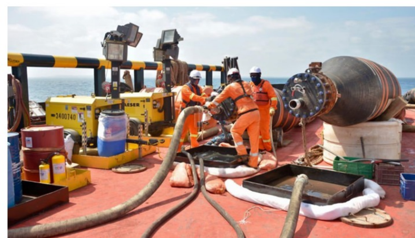
Con presencia del Grupo Ecopetrol y Gobierno Nacional, Ocesa inauguró Unidad de Cargue de Crudo TLU-2 en Coveñas

Los trabajos, que se planearon desde hace dos años, tuvieron una duración de alrededor de 50 días y le permiten ahora al país contar con uno de los sistemas más robustos y confiables de cargue costa afuera, con tecnología de punta para los próximos 20 años.