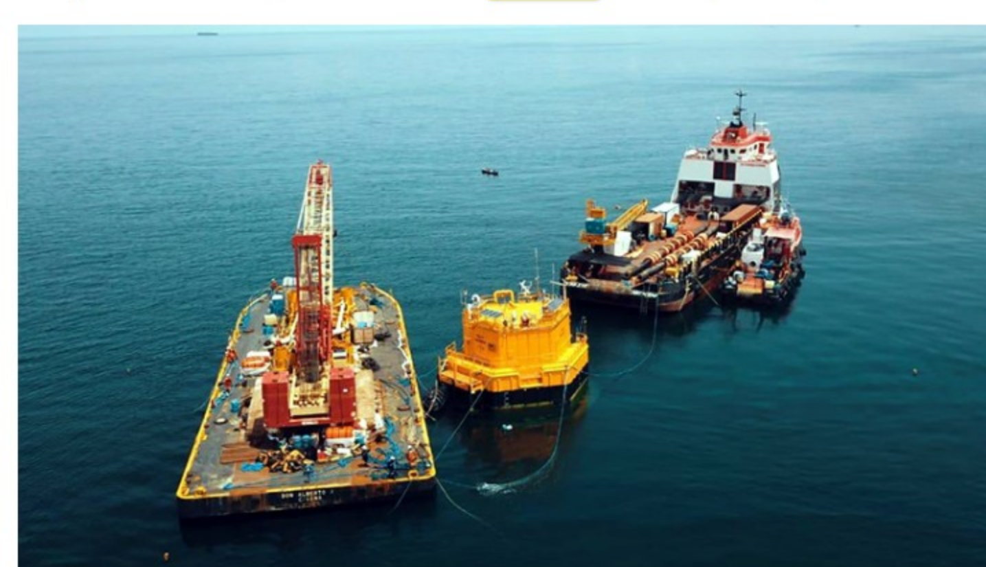
Con presencia del Grupo Ecopetrol y Gobierno Nacional, Ocesa inauguró Unidad de Cargue de Crudo TLU-2 en Coveñas

La nueva Unidad de Cargue de Tanqueros (TLU-2 o monoboya), que será operada por Ocesa durante 20 años más, además de servir para la exportación de crudos, es bidireccional, lo que significa que también permitirá importarlos y tiene una capacidad de cargue que oscila entre 50.000 y 60.000 barriles por hora . Pesa unas 300 toneladas y está dotada de mangueras flotantes para transferir el petróleo a los buques-tanque.