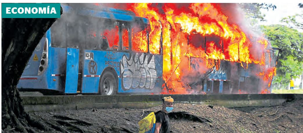
Varios buses del MIO y 2 estaciones fueron quemadas en Cali durante el paro.

Yann Hedoux, presidente de la operación en el país, explica cómo ha sido la actividad en pandemia y el plan de expansión de los servicios. Pág. 4