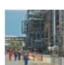
Reficar : las claves del desfallo

“El daño patrimonial determinado y cuantificado en el fallo de la Contraloría General, se produjo con ocasión de las acciones y omisiones de la junta directiva de Reficar y su administración, contratista y supervisor del proyecto, quienes en ejercicio de la gestión fiscal directa o indirecta, de manera antieconómica, ineficiente e inoportuna, contribuyeron a esta billonaria pérdida de recursos públicos, que se convierte en el mayor detrimento patrimonial del Estado colombiano en toda su historia ”, anotó la Contraloría.