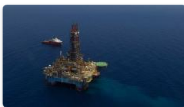
Gobierno expidió reglamentación para industria costa afuera