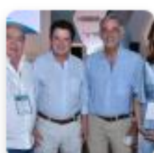
Cumbre 'Offshore Investment Summit 2019'

Invercionistas de industria offshore se reúnen desde este jueves en Barranquilla