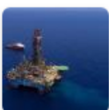
Ecopetrol y Shell firman acuerdo para desarrollar provincia gasífera del Caribe