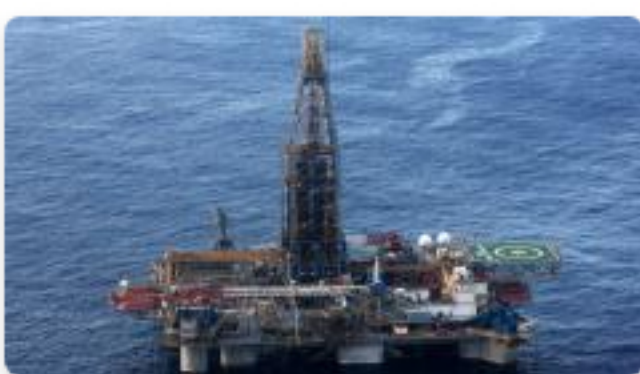
"Asociación de Shell y Ecopetrol en offshore favorece a la Costa Caribe"