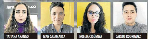
Sura Asset Management

Periodistas de LR que participaron en el Inside LR