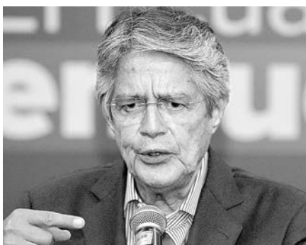
Guillermo Lasso presidirá Ecuador