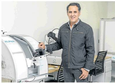
Cámara Lúcida de Colombia

Full Frame México y la Cámara Lúcida de Colombia, liderada por Oscar Garcés, se unieron para poner a disposición en el país equipos de última tecnología en materia de fotografía para el mercado del e-commerce. Esto le permitirá a las compañías en Colombia contar con una buena calidad en sus imágenes con detalles precisos de productos que deseen que los consumidores vean en sus plataformas oficiales. (UL)