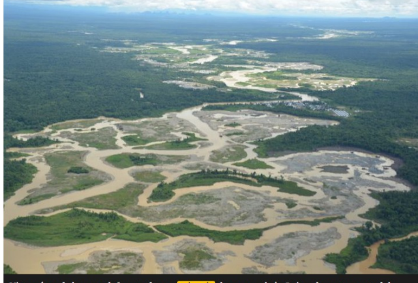
Vista aérea de bosque deforestado por minería de oro en el río Quito, departamento del Chocó, Colombia.