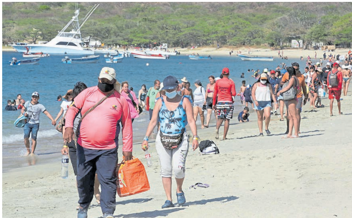
Santa Marta fue uno de los destinos turísticos más afectados por tercera ola de la pandemia.

Según las cifras preliminares de los capítulos de Cotelco, Santa Marta tuvo una ocupación de apenas el 38% debido a la amenaza del tercer pico de la covid-19, mientras que San Andrés llegó a 91%. La mayoría de los destinos tuvieron resultados por debajo de sus metas. Pág. 3