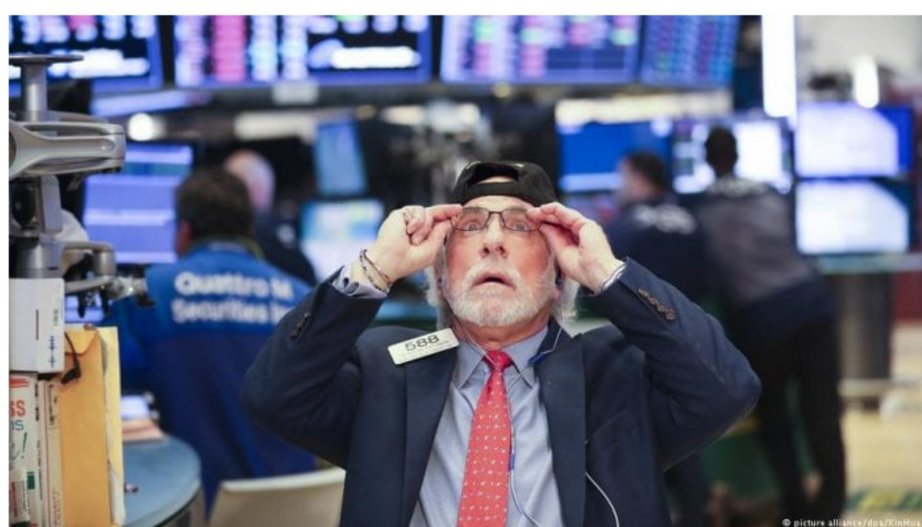
Nyse - Nueva York

Así se fue a los títulos de Bancolombia, Grupo Aval, Ecopetrol y Tecnoglass que se negocian en la Bolsa de Nueva York.