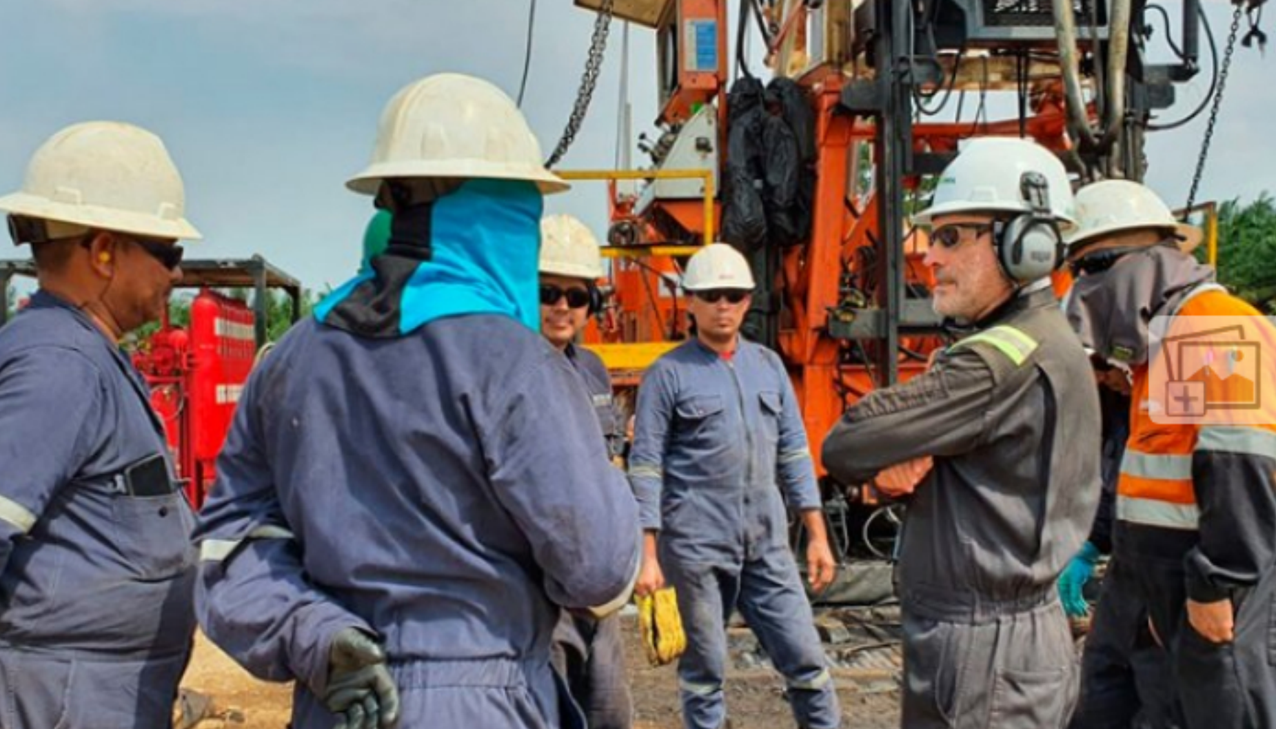
Los directivos de Ecopetrol están preocupados por la vida de más de 520 empleados que laboran en el Campo Tibú y Campo Sardinata.

Les han robado 31 de las 50 camionetas que utilizan en la región.