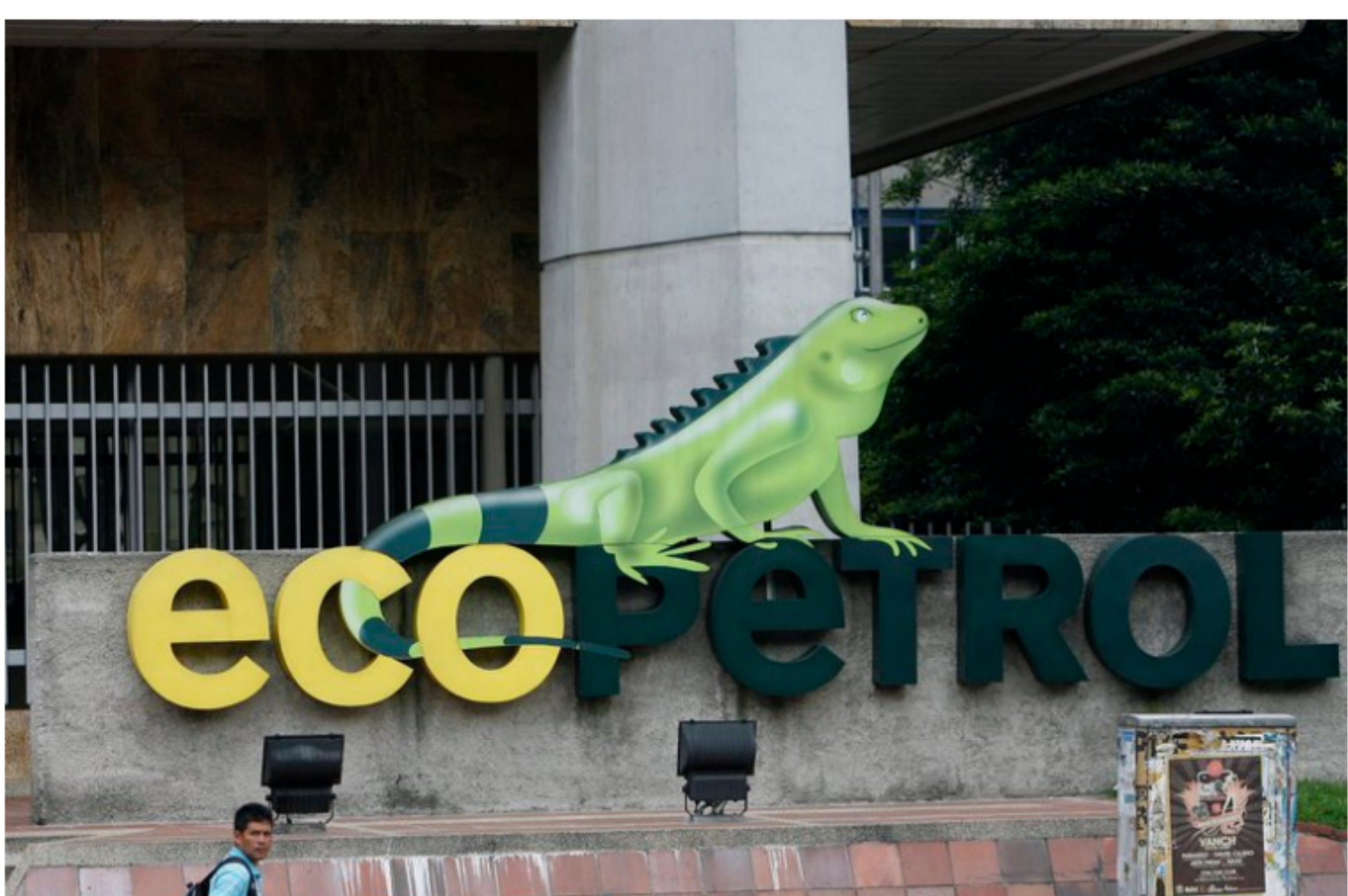
Vista del logo de la petrolera estatal colombiana Ecopetrol en la fachada de su edificio sede en Bogotá (Colombia).

Bogotá, 30 oct (EFE).- La petrolera estatal colombiana Ecopetrol advirtió este viernes que la ola de delincuencia en la región del Catatumbo, fronteriza con Venezuela, está poniendo en riesgo cientos de empleos, millonarias inversiones y la operación en general de la compañía en esa convulsa región del país.