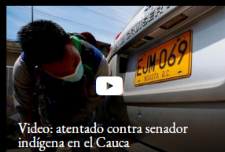
Video: atentado contra senador indígena en el Cauca