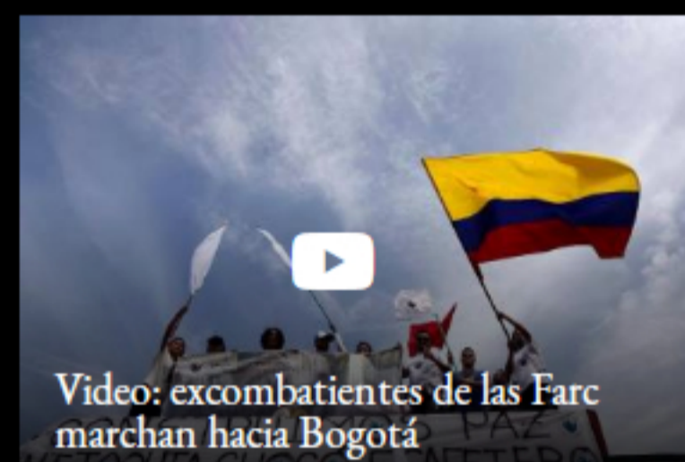
Video: excombatientes de las Farc marchan hacia Bogotá