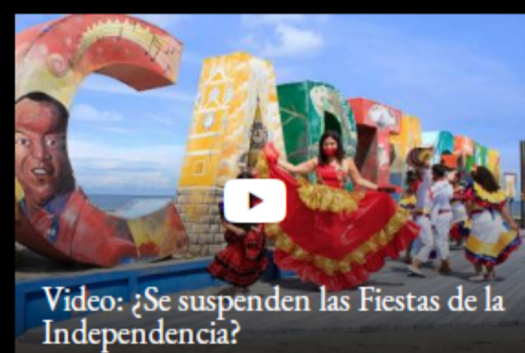
Video: ¿Se suspenden las Fiestas de la Independencia?