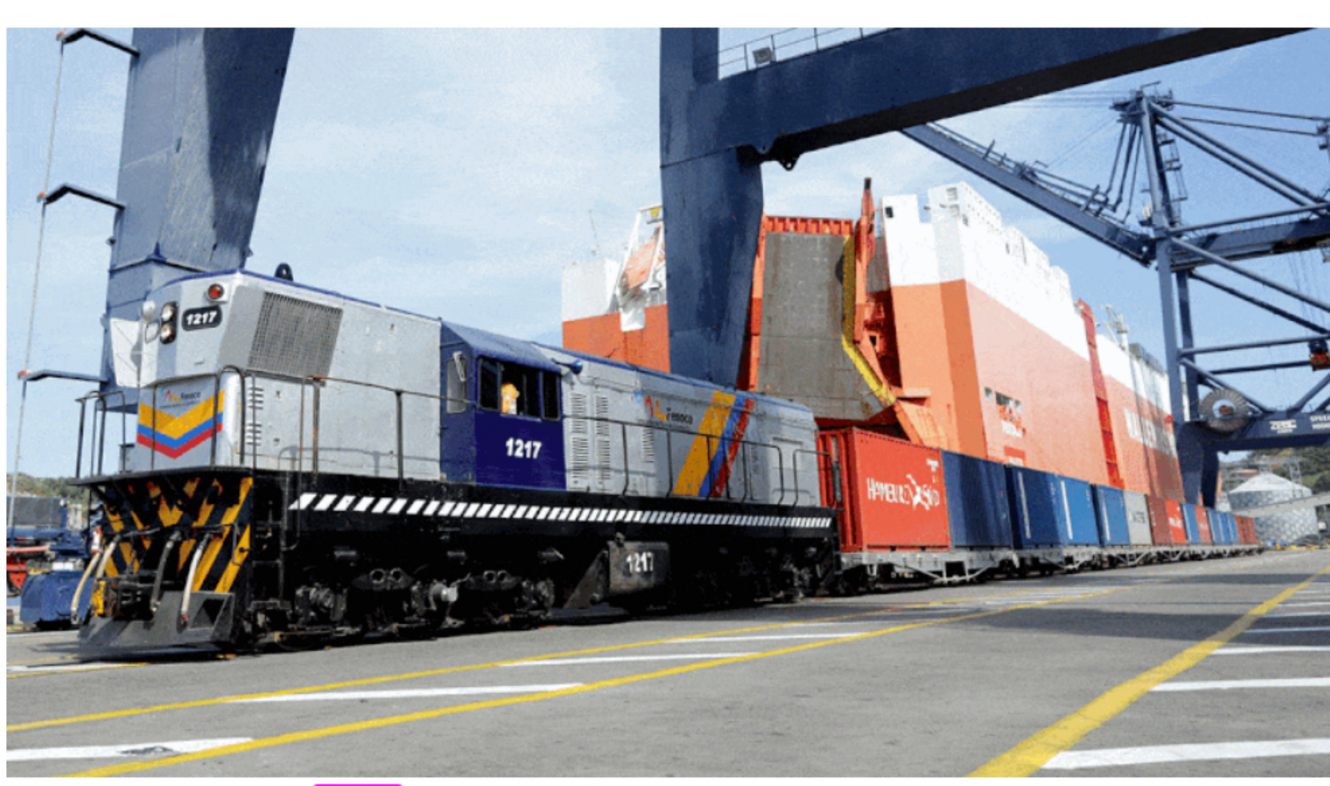
Pixabay / Grupo Puerto de Cartagena / Ministerio de Transporte Colombia