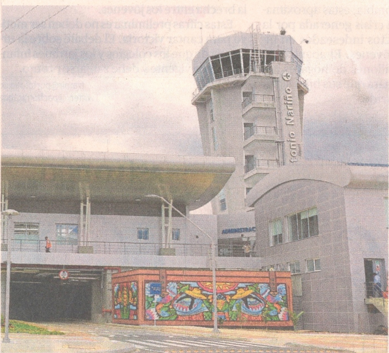
El aeropuerto Antonio Nariño (Pasto), remodelado, está en operación.

Las terminales aéreas de Leticia, Armenia y la pista sur de El Dorado serán entregadas este año. Hace una semana fue dado al servicio el aeropuerto de Pasto. Avanzan en ampliaciones y remodelaciones en 9 ciudades más. Pág. 6